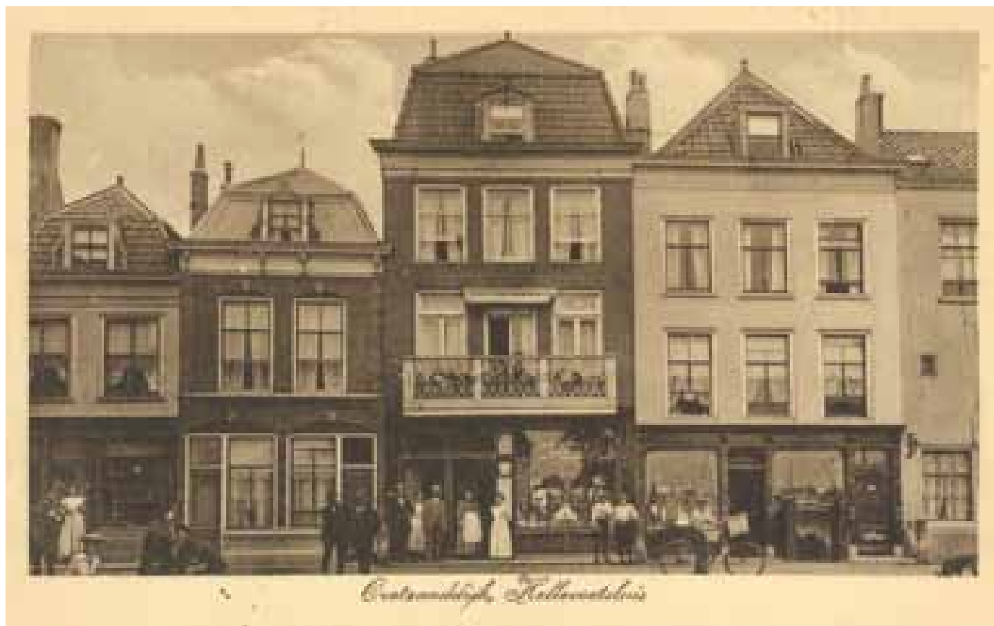
Het huis waar Roosje woonde is het tweede huis van links, de linkse deur was nr. 8a.

Bijna allemaal zijn ze doorgestuurd naar Westerbork en vandaar op 2 november naar Auschwitz. In diezelfde trein zaten ook de families Katan en Cohen uit Brielle.