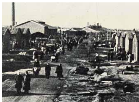
Boulevard des Misères, de Hoofdstraat in Westerbork

Toen de Duitsers op 10 mei 1940 ons land binnenvielen, woonden er zes Joden in Oostvoorne. Dit waren het gezin Wessels en hun zonen aan de Stationsweg en het echtpaar Van Dijk aan de Brielseweg.