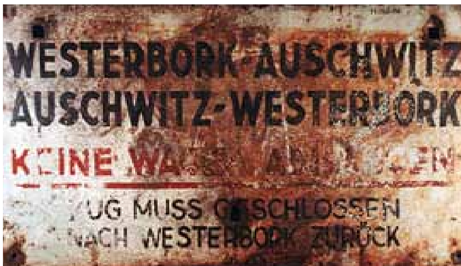
IJzeren treinbord Westerbork - Auschwitz

Op 17 augustus 1942 werden ze door hun ouders naar het tramstation gebracht. Het trammetje reed eerst naar Loods 24 in Rotterdam, dat was een verzamelpunt. Vandaar naar Westerbork en vervolgens naar Auschwitz. Eind september waren ze niet meer in leven. Maar dat wist niemand in Brielle. De ouders bleven hopen dat zij een brief zouden schrijven.