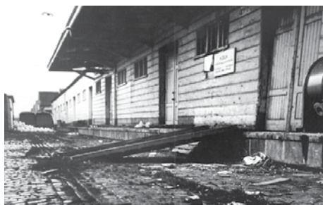
Loods 24 in Rotterdam

Vanaf 3 mei 1942 was het Joden verplicht deze ster te dragen.