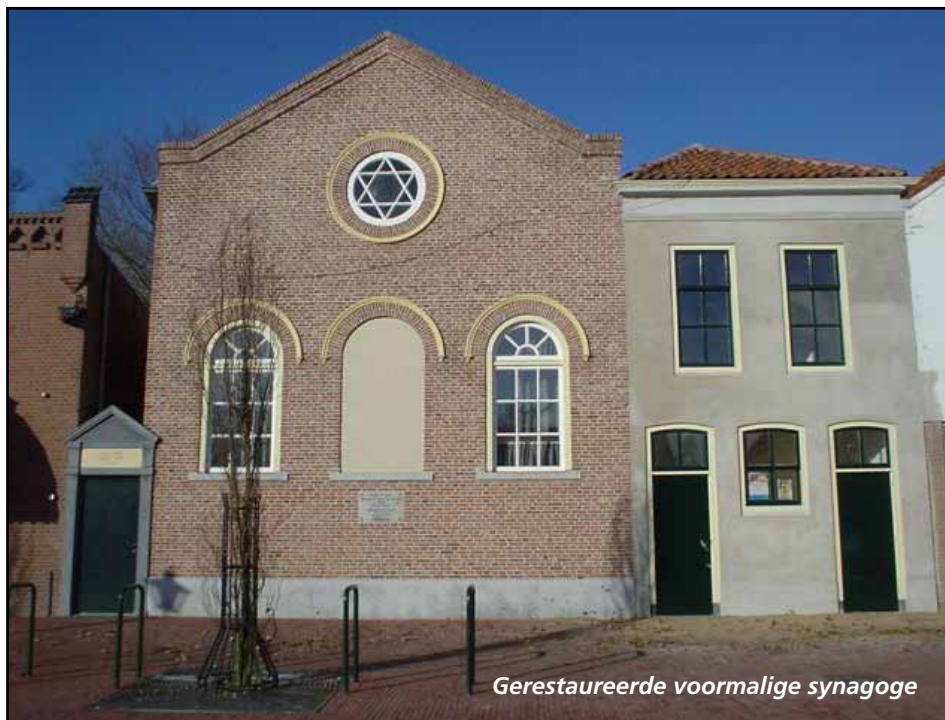
Gerestaureerde voormalige synagoge

Na de oorlog was hier geen Joodse gemeente meer en de synagoge werd verkocht als pakhuis. Dat bleef het bijna 60 jaar. Toen werd de synagoge gerestaureerd en sinds 2005 ziet hij er weer net zo uit als in 1871.